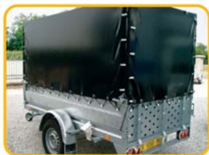
Esempio di centinatura e telo