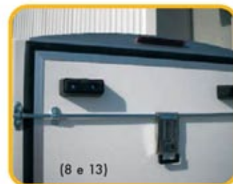
(8 e 13)