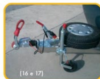
(16 e 17)