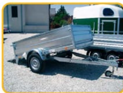
Esempio di sovrasponde