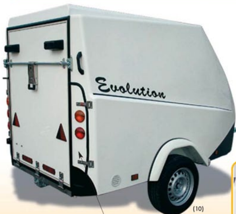
Optional: aperture quad