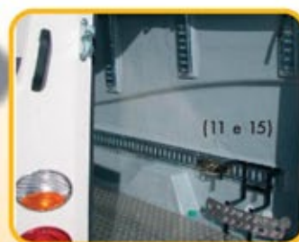
(11 e 15)